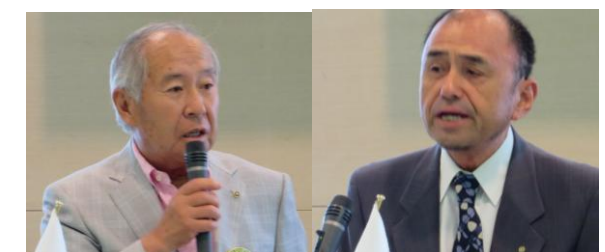
徳山 25 周年記念事業