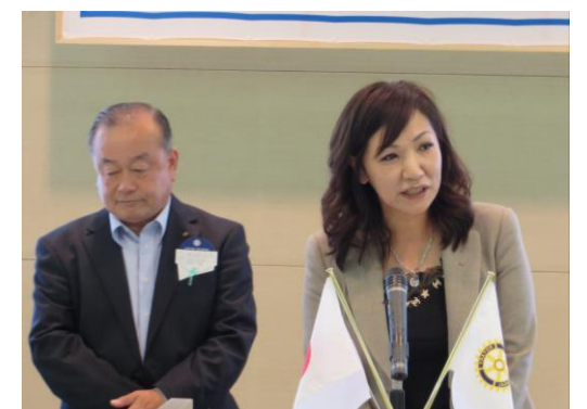
京都八幡 RC 横須賀幹事・開原会長