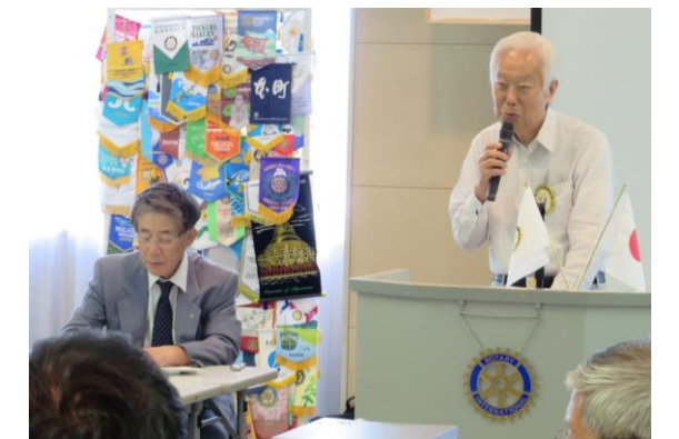
「第1回クラブフォーラム」 会員増強委員会