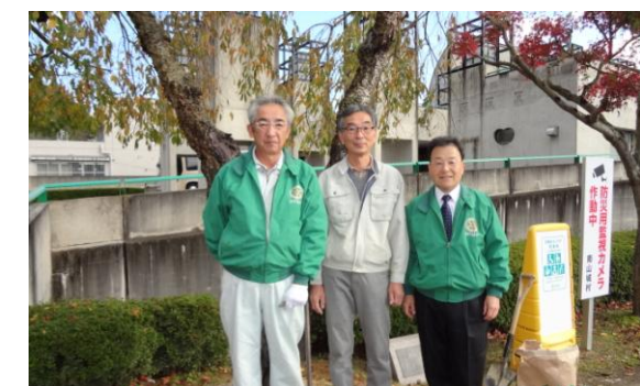
第2回ゴルフ同好会 11月21日(金)