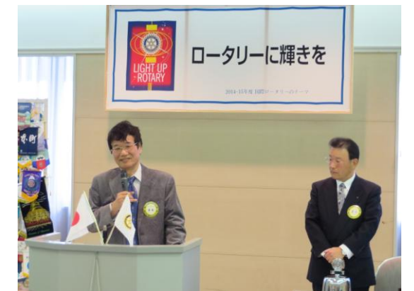
中岡会員・吉本会員夫妻 脇田会員・上村会員