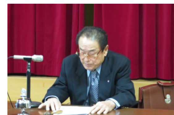
年男放談 尾崎会員