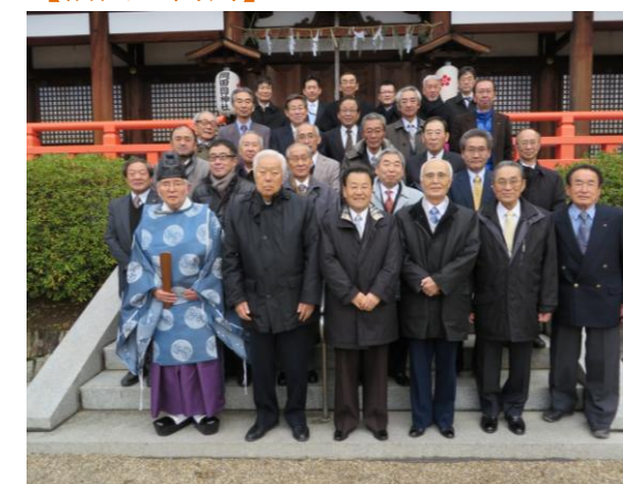
岡田国神社にて初例会