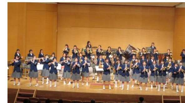
木津川市立第二中学校 吹奏楽部