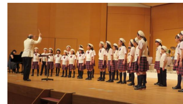
精華町少女少女合唱団