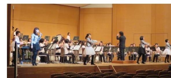
ベリーズけいはんな