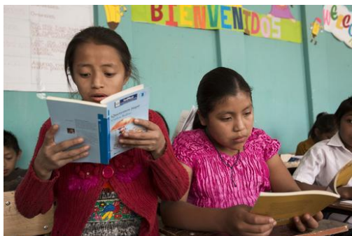
Rotary International Education より

さて、次週の3月14日は我々のクラブの創立記念日であります。そしてその日に開催させて頂きます、創立25周年記念式典及び祝賀会を、どうか全会員のご協力を頂きますよう宜しくお願いいたします。この節目に、心を新たにしてロータリーの奉仕の理想に近づくようお互いに精進し、亦、次なるステージへの確かなる道りを歩んでいくためにも、3月14日の出発点に立ち、最初の一步を踏み出せることを糧として進んで行こうではありませんか。