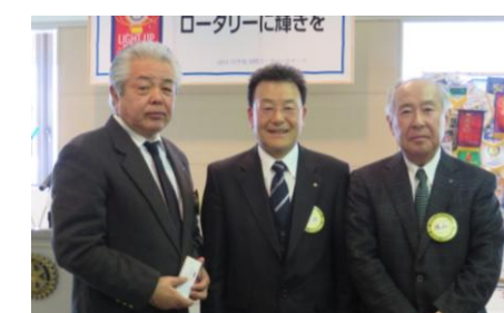
皆出席 18 年福井(康)会員