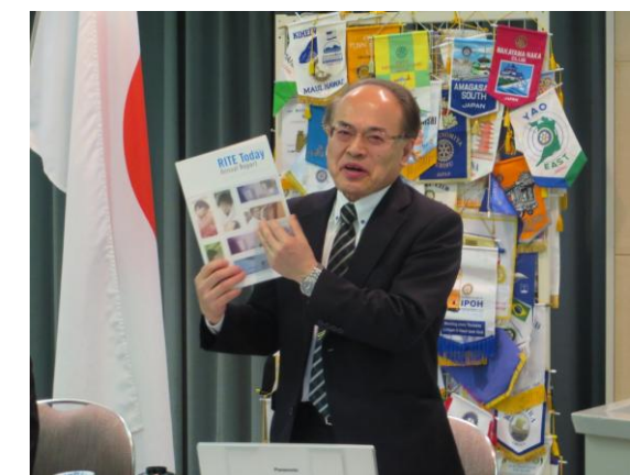
「地球環境産業技術研究機構について」